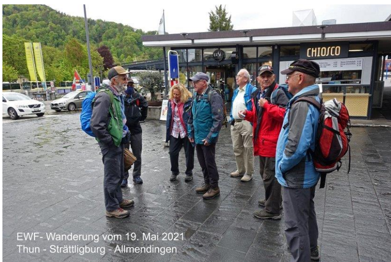
EWf- Wanderung vom 19. Mai 2021 Thun - Strättligburg - Allmendingen