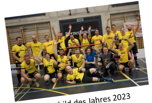
SVSE-Sportbild des Jahres 2023

Eine grosse Chance, den Bergsport innerhalb des SVSE etwas mehr ins Rampenlicht zu rücken!