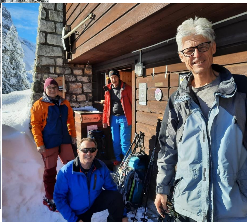
links und unten: Ein wunderbarer, schöner Sonntag mit blauem Himmel und gut einem Meter frischen Pulverschnee.