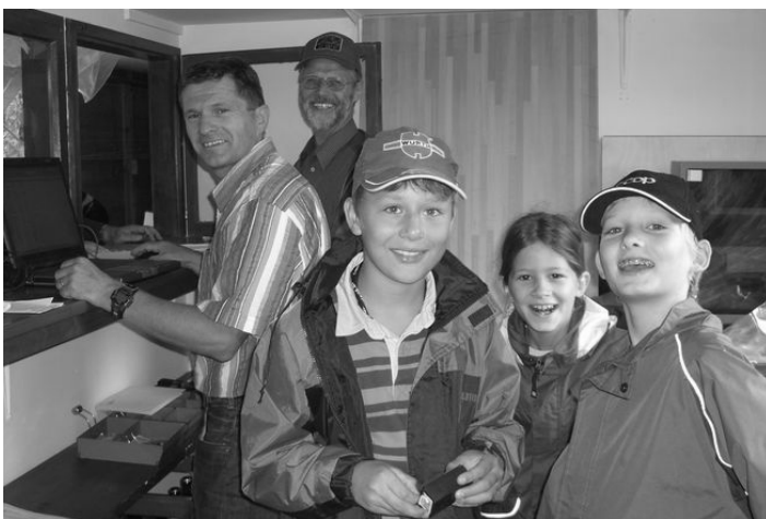
Eindrücke vom Plauschschiessen 2009: Büro-Crew und Helfer/innen

Ort Kleinkaliber-Schiessstand Espel, Gossau SG